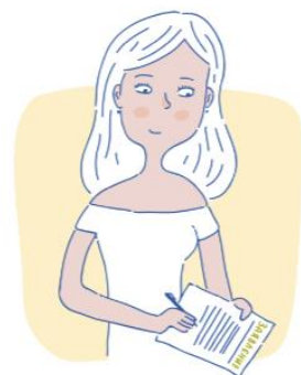
КАК ПОЛУЧИТЬ СЕРТИФИКАТ?

Персонифицированное финансирование предполагает определение и закрепление за ребенком денежных средств в объеме необходимом и достаточном для оплаты выбираемого им или его родителями дополнительного образования с последующей передачей средств в организацию дополнительного образования или индивидуальному предпринимателю.