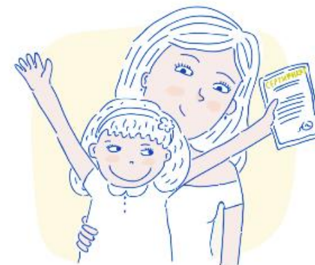
ЧТО ТАКОЕ СЕРТИФИКАТ?

С 1 сентября 2018 года на территории Томской области вводится система персонифицированного финансирования дополнительного образования детей (сертификат дополнительного образования)